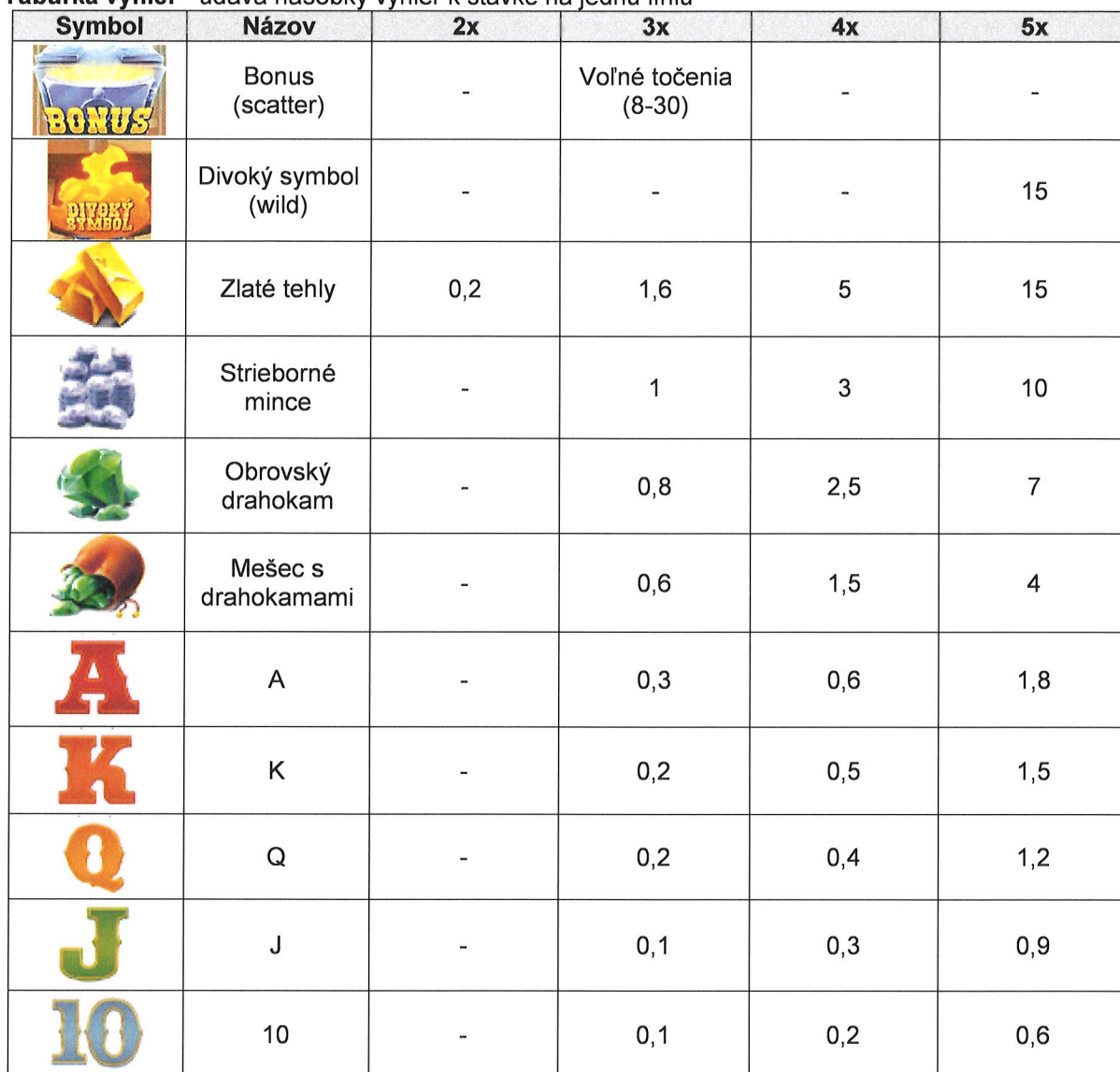
Tabuľka výhier - udáva násobky výhier k stávke na jednu líniu