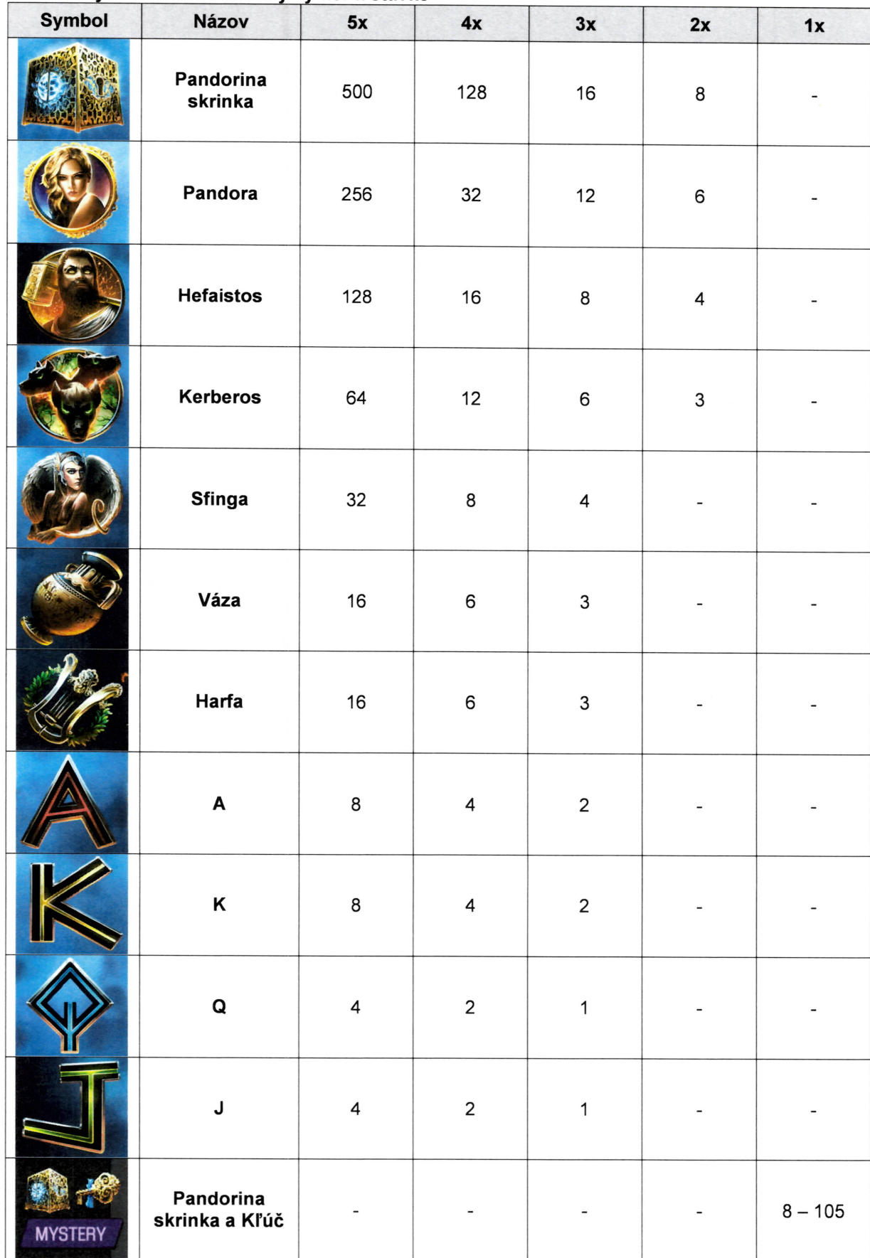
Tabuľka výhier: udáva násobky výhier k stávke